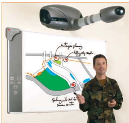
Tablica cyfrowa prezentowana wraz z Cyfrowym systemem multimedialnym 3M serii 800